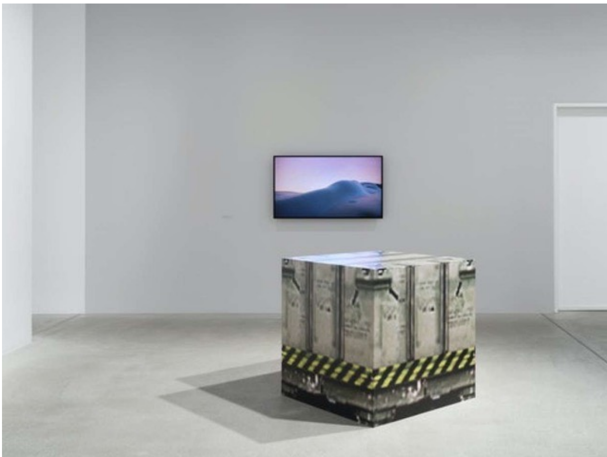
Mitglieder-Einladung | Ausstellung «How to win at photography - Fotografie als Spiel» | Fotomuseum Winterthur | Winterthur

Weiter gab es Einladungen zu Festivals wie: «Internationale Kurzfilmtage Winterthur», Winterthur | «Open-Air-Kino Xenix», in Zürich. Schliesslich auch 3 Einladungen zu Film-Streamings (Spiel- und Dok-Filme). Die Einladungen stiessen auf reges Interesse.